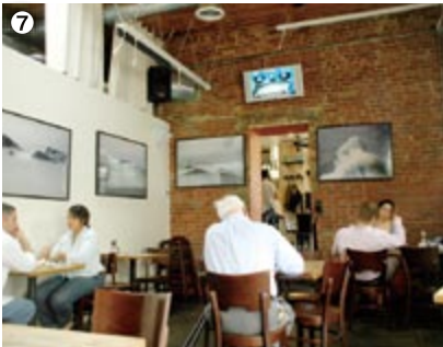
⑤音響と照明がばっちり整ったライブスペースで、カラオケナイト! ⑥現役の暖炉もあるレストランスペース。 ⑦レンガの壁と道路に面した大きな窓からの光に、飾られた写真が映えるギャラリー。 ⑧「SCHNITZEL」(14ドル95セント)と「MOTT HAVEN MARGARITA」(10ドル)。