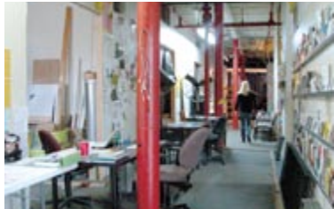
当初何もなかった約4500sqftの空間に、自分たちで壁を立てて9部屋に分け、シャワーまでつけた。